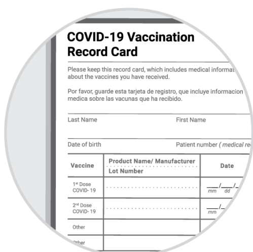
Kard ng Pagbabakuna

Kabilang sa mga wastong anyo ng pagpapatunay ang: