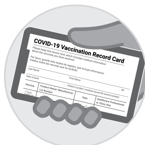
Larawan ng kard ng Pagbabakuna