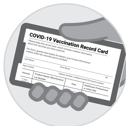
Фотографія картки вакцинації