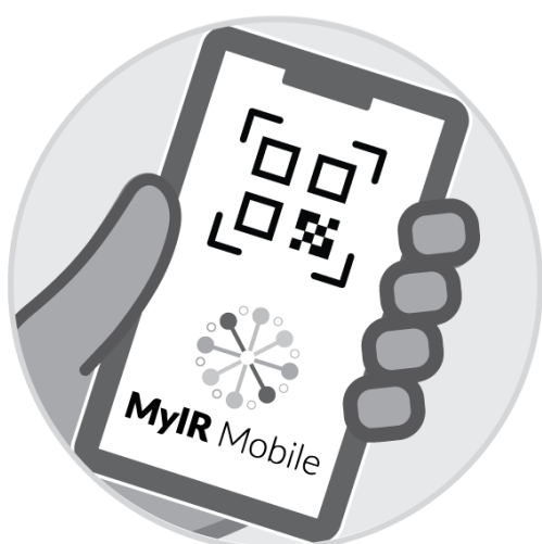
Запис з MyIRMobile.com або іншого застосунка