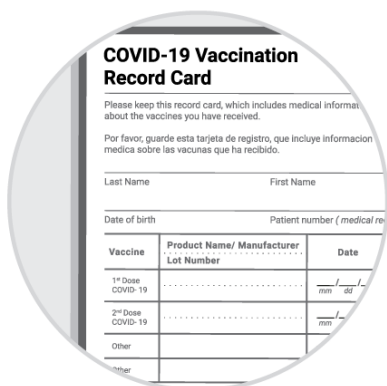
Kard ng Pagbabakuna

Kabilang sa mga wastong anyo ng pagpapatunay ang: