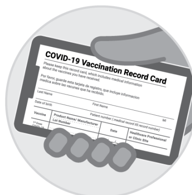
Larawan ng kard ng Pagbabakuna