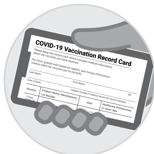
Фотография прививочной карточки