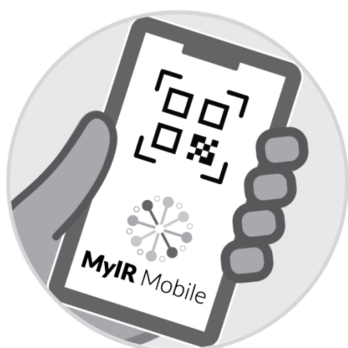
Запись с MyIRMobile.com или другого приложения