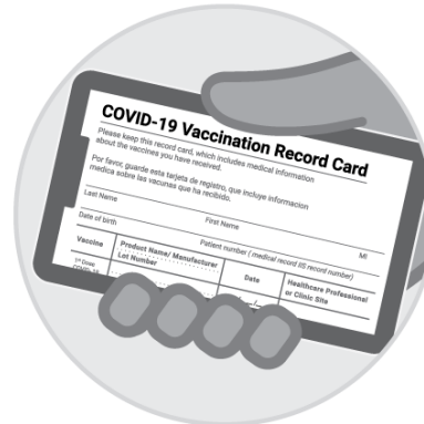
백신 접종 카드를 촬영한 사진