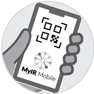
MyIRMobile.com 또는 기타 어플에서의 기록