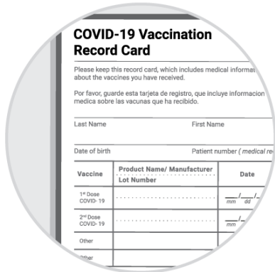
백신 접종 카드