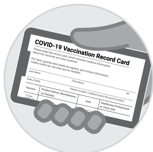
疫苗接种卡的 照片