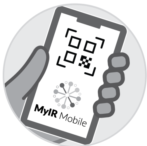
MyIRMobile.com 或其他应用程序 上的记录